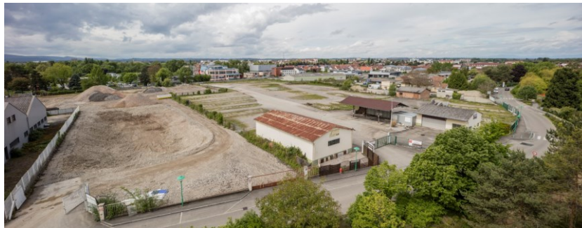
Vision panoramique du site depuis le quai du Maroc

Sur ce périmètre, la Ville souhaite mettre en valeur les terrains pour compléter l'aménagement des bords du canal, qui est déjà valorisé par le Parc des Eaux Vives, situé à proximité du secteur. Il s'agit de réaliser un quartier résidentiel à forte dimension paysagère et proposant une offre de logements, accompagnée par l'arrivée d'équipements scolaires et proposant une offre de logements, accompagnée par l'arrivée d'équipements scolaires pour les besoins des nouveaux arrivants mais aussi en remplacement d'écoles actuelles.