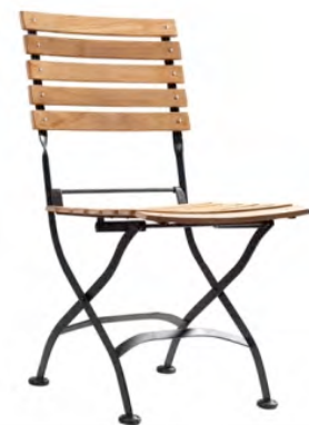
Structure fonte galvanisée, assise et dossier bois