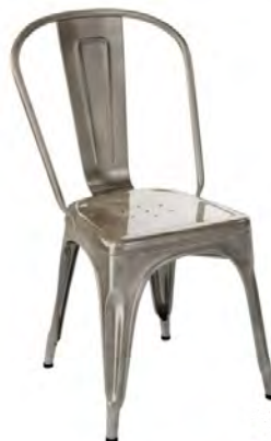
Structure, assise et dossier acier