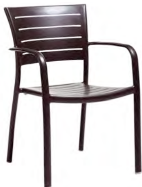
Structure, assise et dossier alu