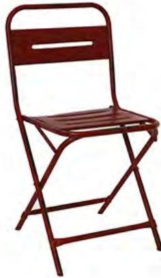
Structure, assise et dossier acier