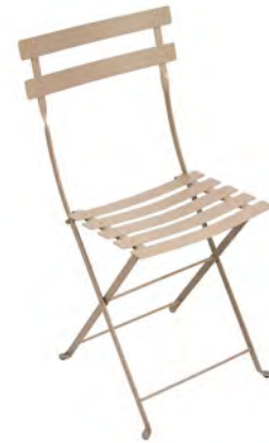
Structure, assise et dossier acier