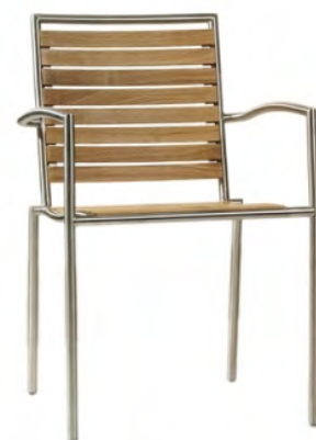
Structure inox, assise et dossier bois