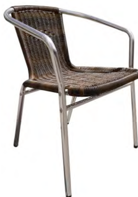
Structure alu, assise et dossier polyéthylène