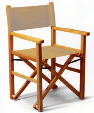
Structure bois, assise et dossier toile

Quelques exemples de modèles parmi beaucoup d'autres possibles :