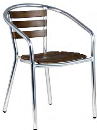
Structure alu, assise et dossier bois